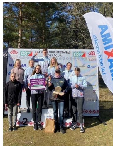
3.attēls. JSVG orientēšanās komanda 2022.g.maijā